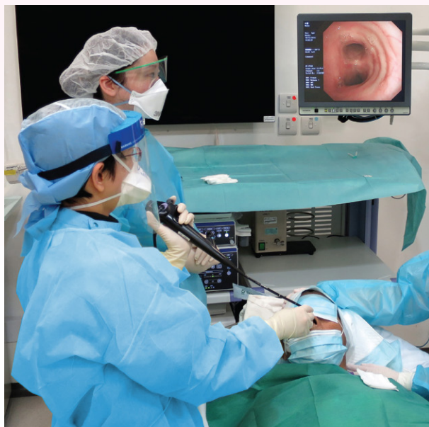
▲ 支氣管內窺鏡檢查